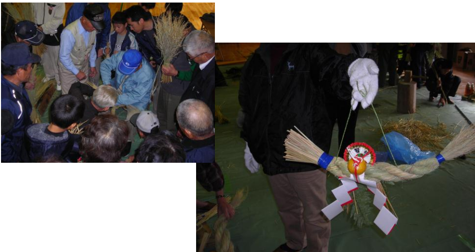
★しめ縄づくり講習会 (平成19年12月23日)